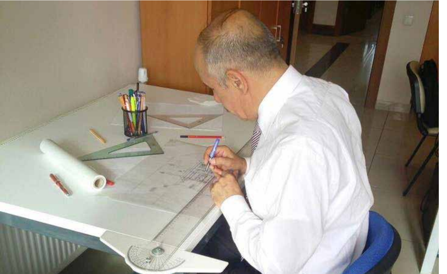
2018 Yılı Eskiz Çalışması