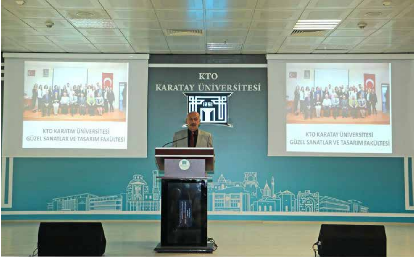
2017-2018 Eğitim Öğretim Yılı Açılış Programı