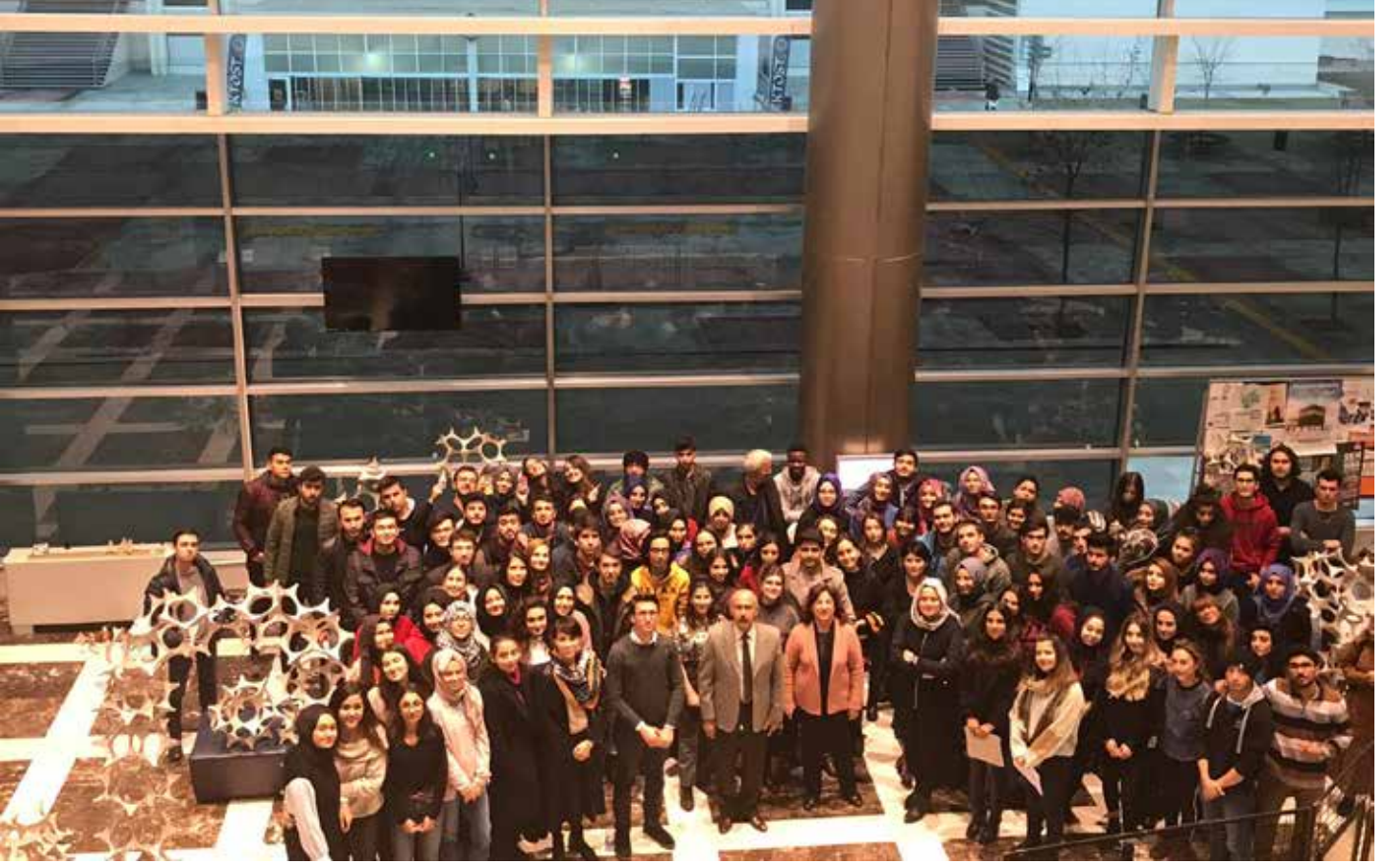
2019 Eğitim Öğretim Yılı Öğrenci Çalışmaları