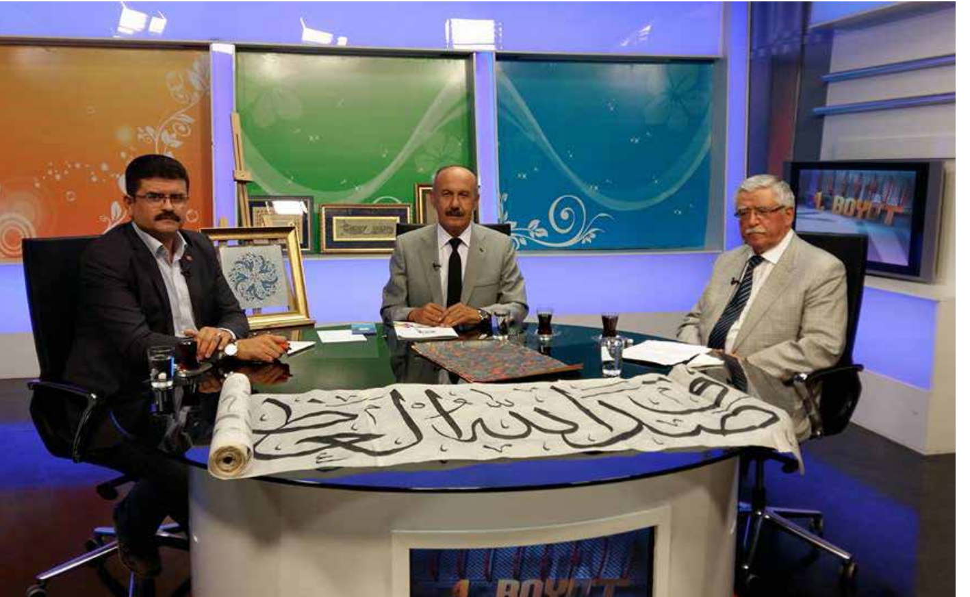
2017 Yılı KONTV 4. Boyut Programı