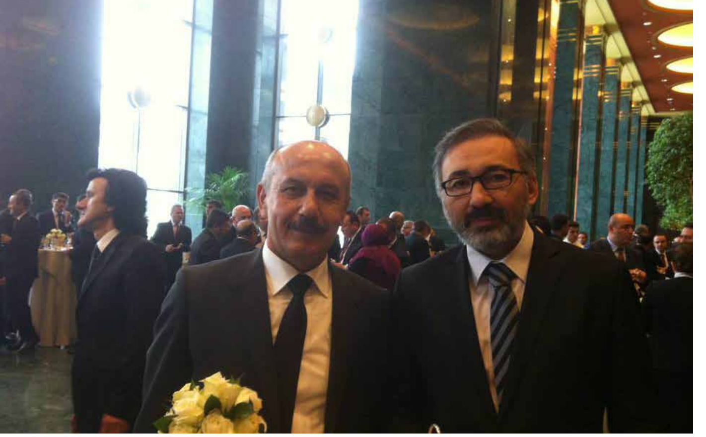
2017 Yılı Cumhurbaşkanlığı Ödül Töreni