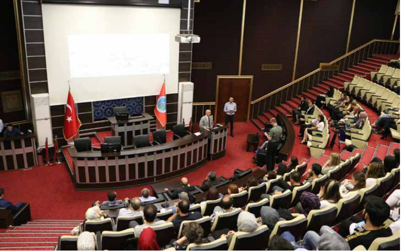
2018 Eğitim Öğretim Yılı Karatay Belediyesi Meclis Salonu'nda Toplantı