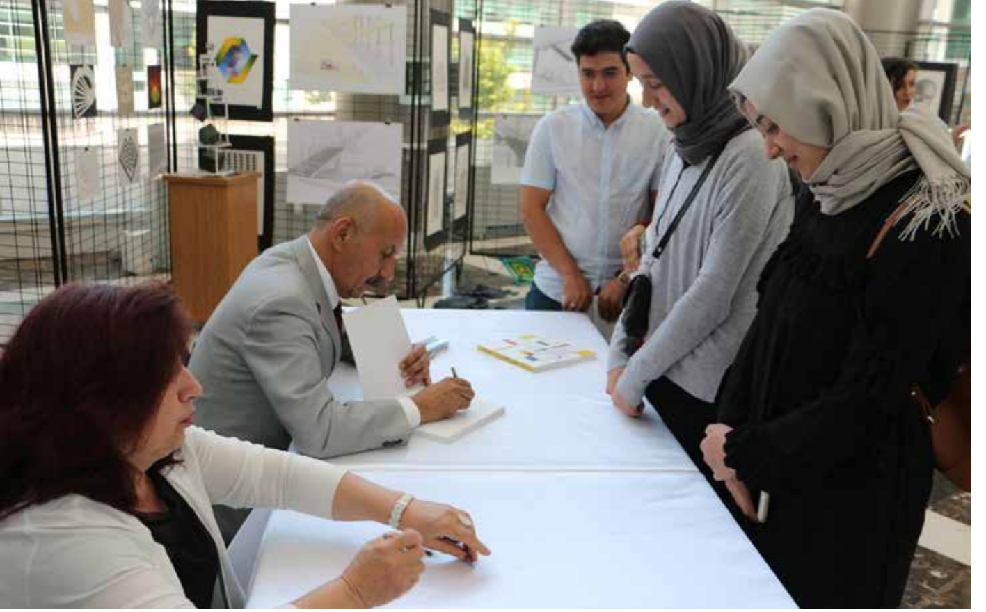
2018 İmza Günü