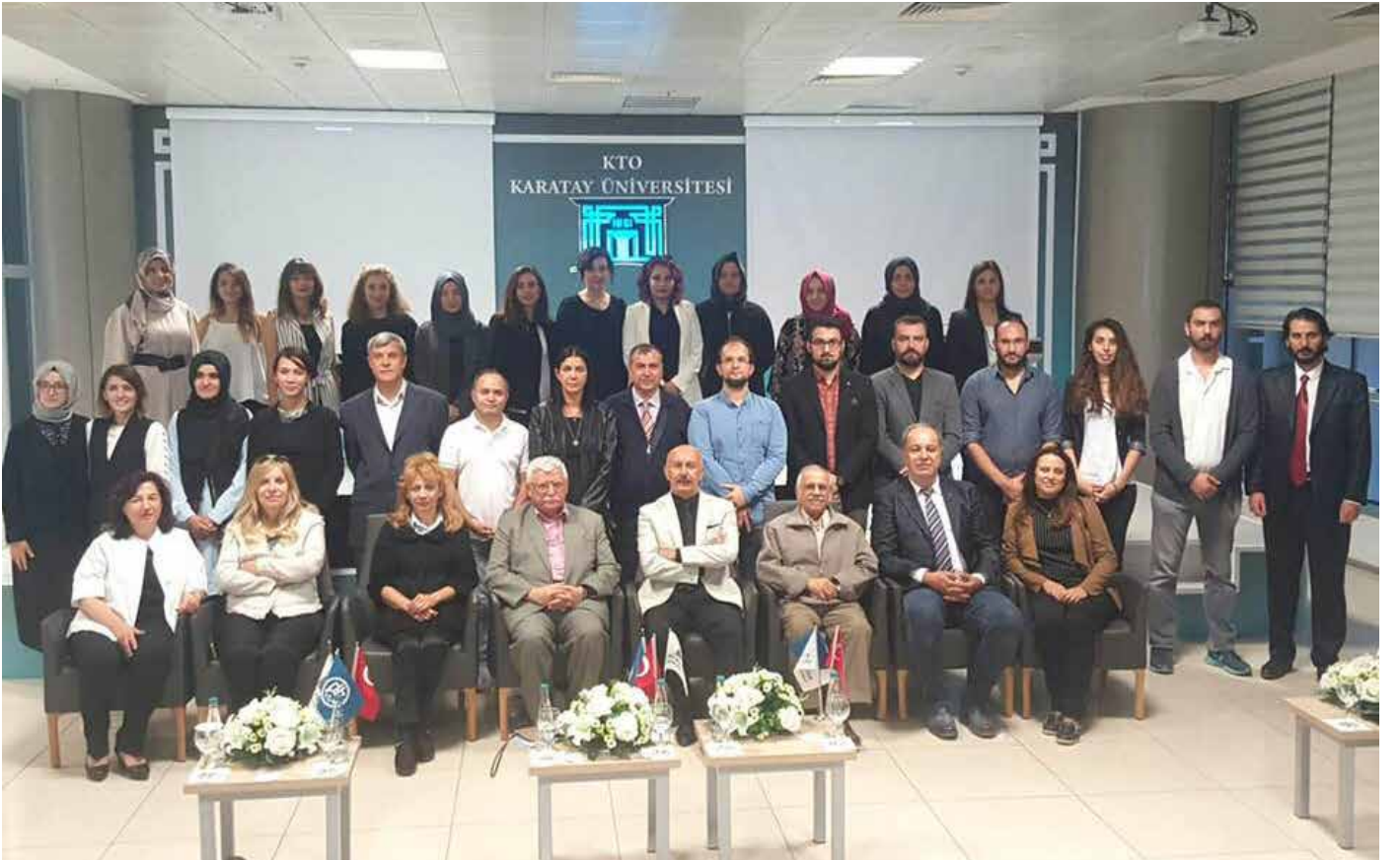
2017-2018 Eğitim Öğretim Yılı Güzel Sanatlar ve Tasarım Fakültesi Öğretim Elemanları